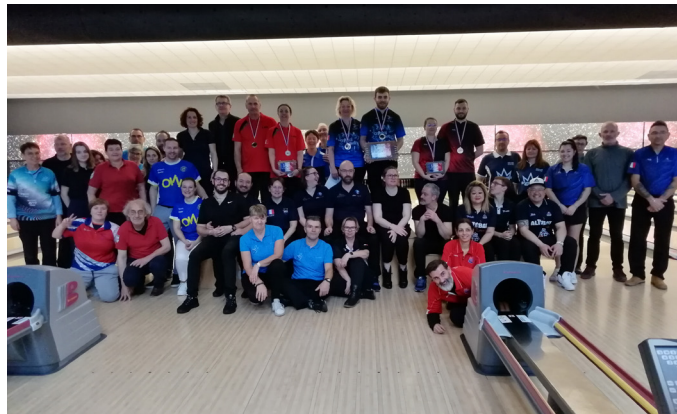
Présentation des certifications «Instructeur Saint-Gall»

Le Championnat de France Sport-Entreprise en doublettes mixtes s'est joué à NOTRE-DAME-d'OE, les 2 et 3 février.