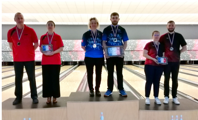
La promo 23/24 et le président de la CT derrière la commission formation