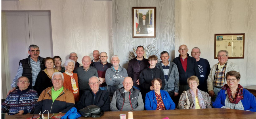
L'ensemble des licenciés du club

LE CLUB E.L.P.B. EST PRÊT POUR CETTE NOUVELLE SAISON !