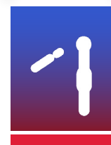
QUILLES AU MAILLET