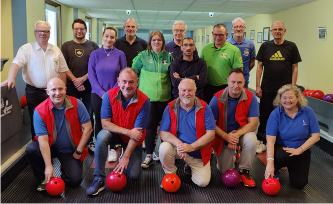
La promo 23/24 et le président de la CT derrière la commission formation