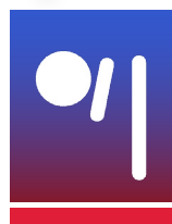
QUILLES DE 8