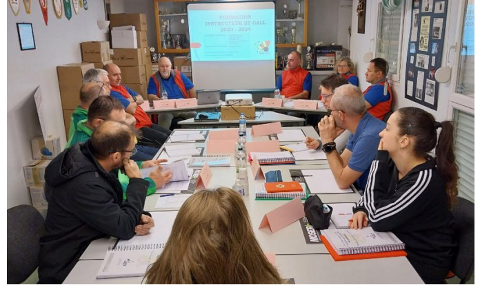
Présentation des certifications «Instructeur Saint-Gall»

Pas moins de 10 candidats avaient répondu à l'appel lancé par le C.S.R. Saint-Gall pour le stage de formation «Instructeur St Gall» de 2023-2024.