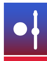
QUILLES DE 9