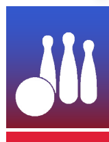
NINEPIN BOWLING SCHERE