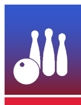
QUILLES DE SAINT-GALL